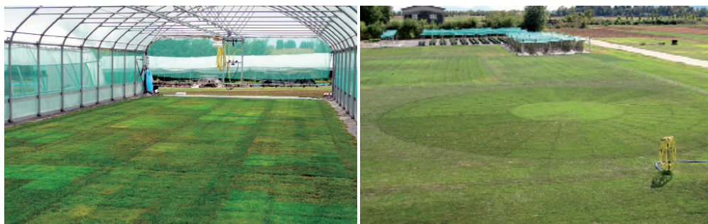
Essais BARENBRUG de stress hydrique (Landlab & Barenbrug Recherche)

* l'indice d'économie en eau est ici obtenu par différence entre les besoins réels en eau du gazon (soit la valeur de l'ETP) et la quantité d'eau effective à apporter à nos mélanges sans altération de leur potentialité (couleur, densité et aspect esthétique)