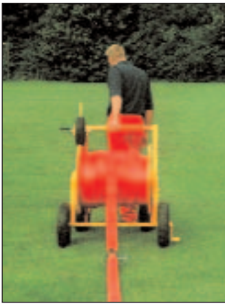
Uitrollen van de slang