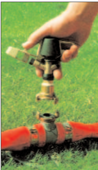
Eenvoudige snelle sproeiermontage