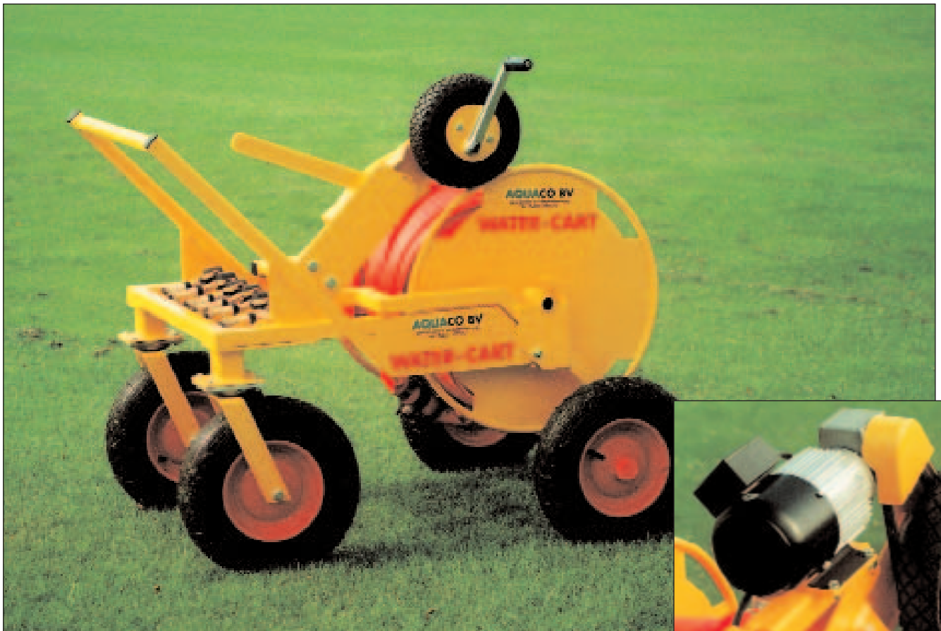
Water-Cart type 99