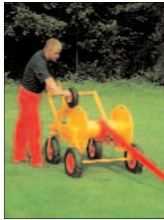
Oprollen van de slang