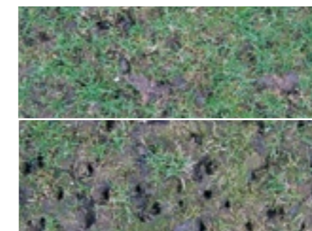
Boven: Goede betredingstolerantie. Onder: Matige betredingstolerantie.

Hebben planten of hun nakomelingschappen de eerste testen overleefd, dan worden ze gekloond om vervolgens te worden gebruikt voor nieuwe proefrassen, de potentiële rassen van de