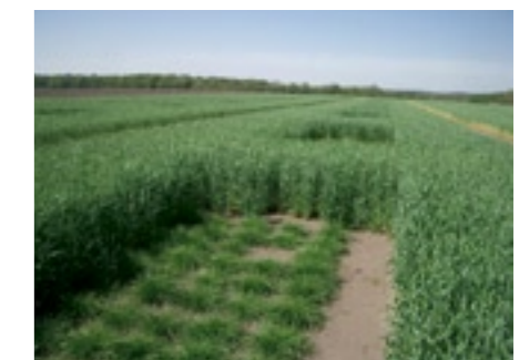
Kruising van klonen in een rogge isolatie.