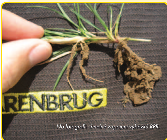
Na fotografii zřetelné zapojení výběžků RPR.

Díky této vlastnosti RPR chrání trávník před poškozením. V porovnání s ostatními odrůdami jílku vytrvalého má RPR vysokou odolnost vůči zátěži. Kvalita odpališť a fairwayů zůstává vysoká i při nejvyšší zátěži během golfové hry, bez zbytečného poškození.