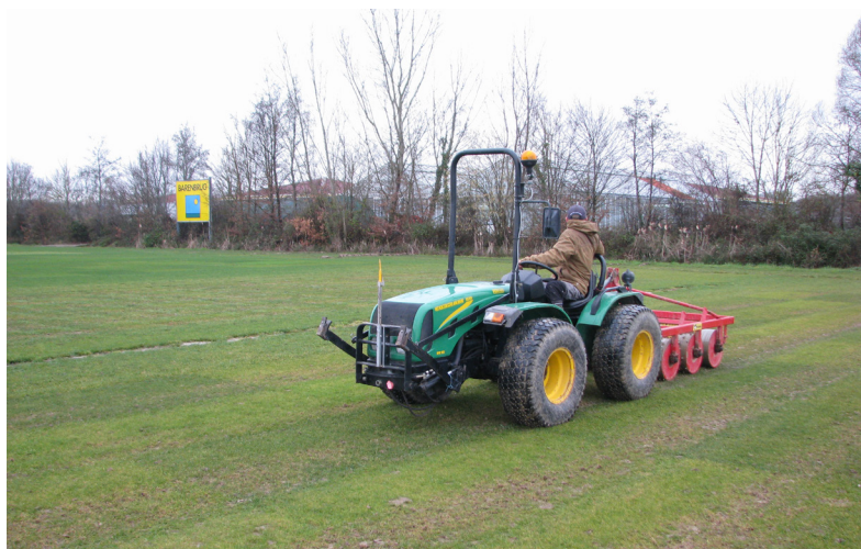
Essais officiels CTPS piétinement

* L'indice sport résistance intègre trois paramètres fondamentaux :