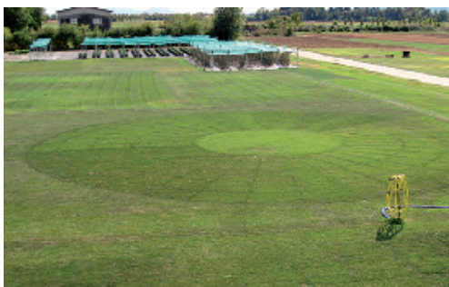
Essais BARENBRUG de stress hydrique (Landlab & Barenbrug Recherche)

* L'indice d'économie en eau est ici obtenu par différence entre les besoins réels en eau du gazon (soit la valeur de l'ETP) et la quantité d'eau effective à apporter à nos mélanges sans altération de leur potentialité (couleur, densité et aspect esthétique)