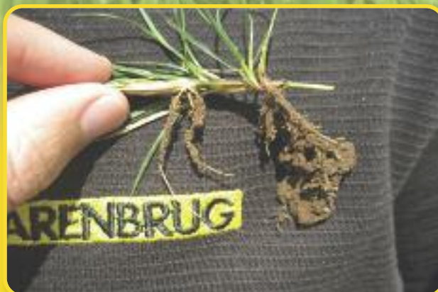
Obrázek ukazuje schopnost výběžků RPR zakořenit.

RPR přináší sílu a rychlost v jedné směsi. Výhoda je v tom, že obě tyto vlastnosti směsi jsou využity ve stejný čas. Rostliny trávníku rychle klíčí, a proto může být po založení hustého trávníku nebo i po poškození velmi rychle a intenzivně používán. To zvyšuje celkovou odolnost hrací plochy vůči zátěži a urychluje zapojení trávníku po výsevu. RPR kombinuje pevnost a sílu s rychlostí založení a regenerací trávníku.