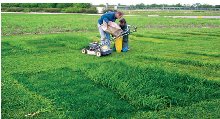
Essais Eco-maintenance (pesée des déchets de tontes) - Mas Grenier

* l'indice éco-maintenance est la résultante d'une économie réalisée à trois niveaux : une fréquence de tonte diminuée ; un volume de déchets générés moins important ; une réduction des intrants (moins d'engrais, moins de traitements, moins d'eau).