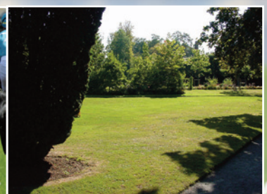
Utilisation possible sur toutes surfaces fortement dégradées