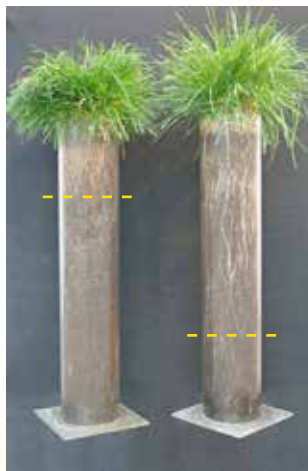
Roddannelse hos alm. rajgræs (til venstre) og blødbladet strandsvingel (til højre).

* Tivoli, Palm, Sameba, Licenta Kilde: Videncentret for Landbrug, landsforsøgene 2010-2012